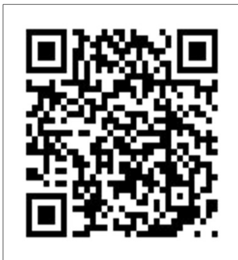
「環境教育友你有我」臉書社團