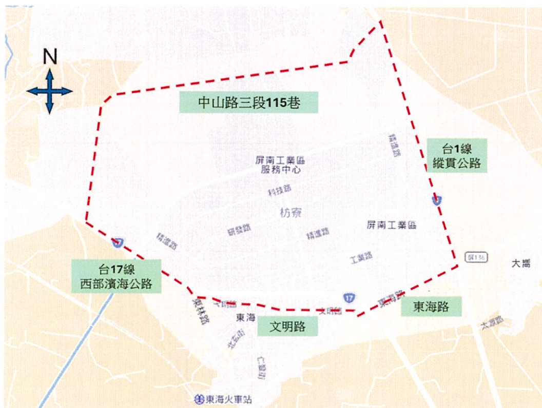
圖 1 屏南產業園區範圍圖